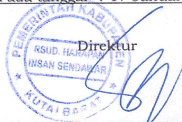
I NYOMAN SUMAHARDIKA

Ditetapkan di : Sendawar Pada tanggal : 17 Januari 2024