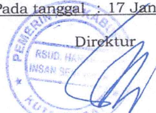
I NYOMAN SUMAHARDIKA

Ditetapkan di : Sendawar Pada tanggal : 17 Januari 2024